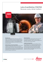
Leica ScanStation P40/P30

Copyright Leica Geosystems AG, Heerbrugg, Switzerland 2017 869534ru - 10.17