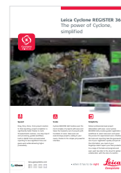
Leica Cyclone REGISTER 360